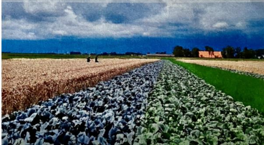
Stroteelt op Nieuw Udengast in Groningen

Kortom, een positieve ontwikkeling in mijn ogen waar ik wel aan mee wil doen.